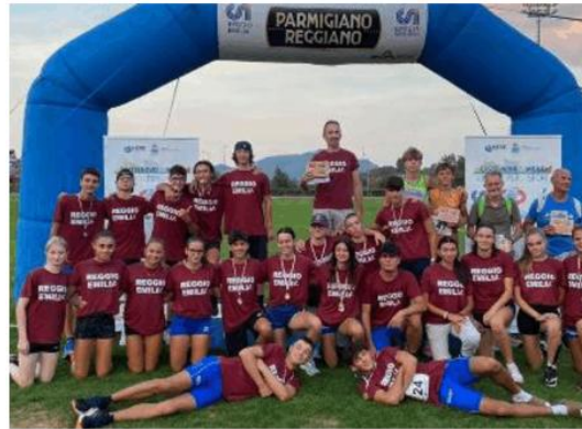
I reggiani hanno vinto 17 gare su 34, lasciando alle avversarie solo le briciole

Aletica leggera: a Castelnovo Monti in gara cadetti e allievi