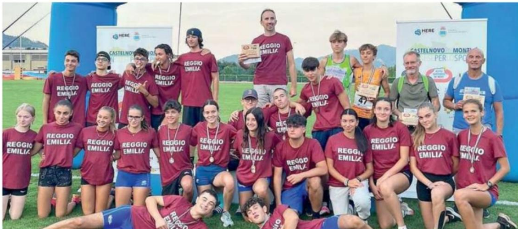
La rappresentativa reggiana che ha dominato il meeting "Esagonale del Po" al Centro Coni di Castelnovo Monti